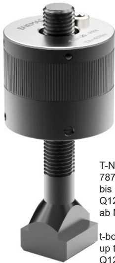
T-Nuttschraube DIN 787 bis M24: Q10.9/ Q12.9 ab M30: Q8.8 t-bolt DIN 787 up to M24: Q10.9/ Q12.9 from M30: Q8.8